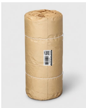
Imagem 6: Modelo de mala lacrada