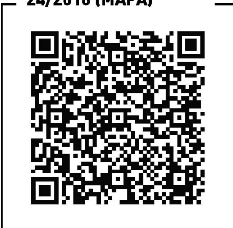
Instrução Normativa 24/2016 (MAPA)