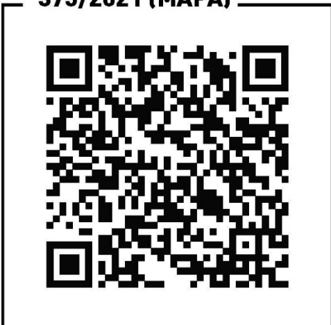
Portaria 375/2021 (MAPA)