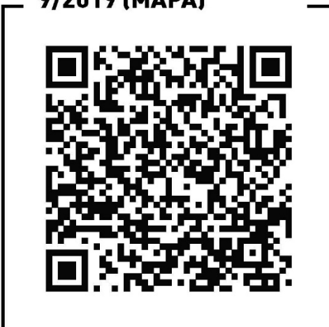
Instrução Normativa 9/2019 (MAPA)