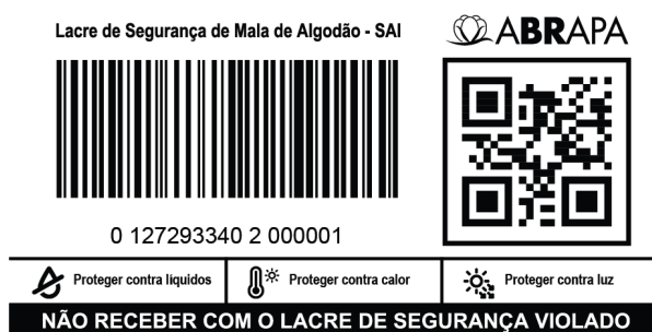
Imagem 3: Modelo de lacre